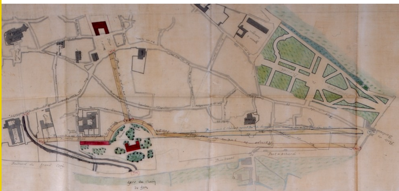
Dessin : Projet de liaison entre la gare, la préfecture et l'hôtel de ville de Poitiers, 1860.

Cette idée est reprise en 1860 par l'architecte Alphonse Durand (1813-1882) à qui le préfet Mercier-Lacombe a demandé de remodeler le projet. Un nouveau site est choisi pour la préfecture, un peu plus haut sur le plateau, mais toujours au-dessus de la gare. Une liaison directe est désormais conçue entre les deux par un escalier d'une part, par un réseau de rues d'autre part : entamé en 1868, le boulevard de Verdun vient ainsi prolonger jusqu'à la préfecture celui de Solférino qui prend naissance à la gare. Le tracé de la rue Victor-Hugo, l'inauguration de l'hôtel de ville en 1875 et le renouvellement urbain du nouveau quartier de la préfecture parachèvent le mouvement. La liaison enfin créée entre la gare et le plateau donne une idée de ce qu'aurait pu être le projet de Pichot s'il avait été exécuté. Et l'implantation aujourd'hui du nouveau théâtre-auditorium à cet emplacement démontre que celui-ci éveille toujours autant d'intérêt.